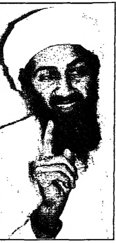
اسامة بن لادن